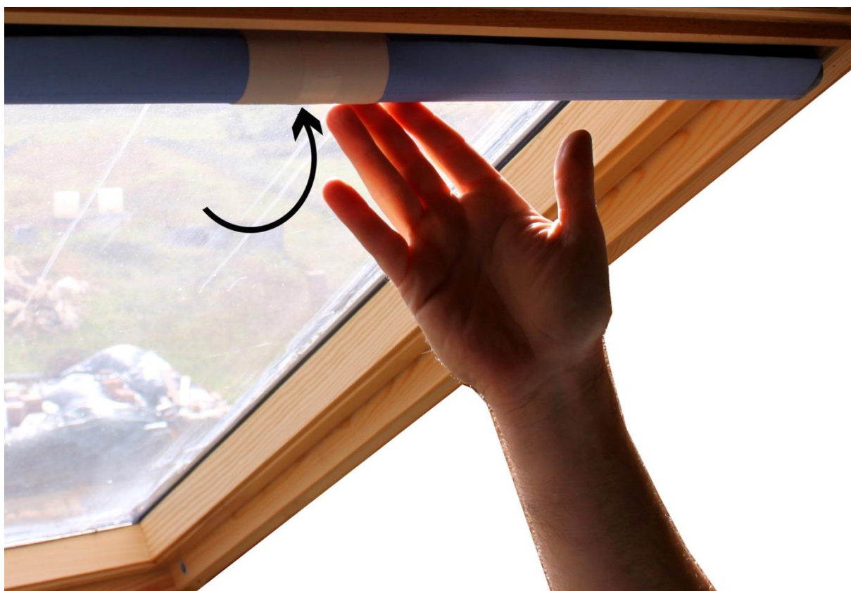
4. Tensionarea arcului.

-dacă ruloul funcționează greu și nu coboară până în partea de jos înseamnă că s-au efectuat prea multe rotații sau nu s-a respectat pasul 2 , fiind prea strânse capetele.