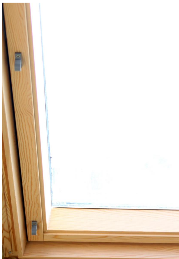
4. Montarea carligelor agatatoare (stanga).

Recomandăm să fie realizate toate verificările pentru a vă asigura că totul funcționează corespunzător, înainte de fixarea șuruburilor.